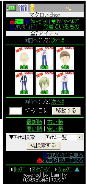
(上:PC 版 下:Mobile 版 JOYSOUND mall 内、「うたスキ shop」「マクロス frontier shop」画面イメージ)