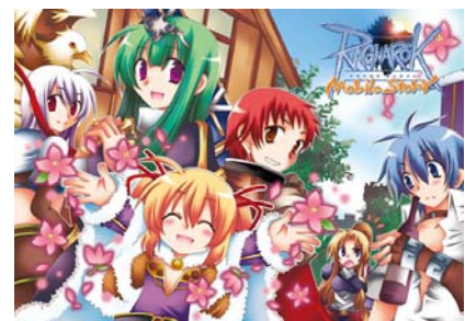
正式サービス記念キャンペーンイラスト

※詳細につきましてはNTTドコモ向け『ラグナロクオンライン Mobile Story』公式サイトをご確認ください。