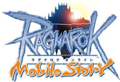
「ラグナロクオンライン Mobile Story」ロゴ