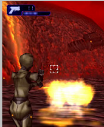
ゲームプレイ中画像：敵を爆破する図