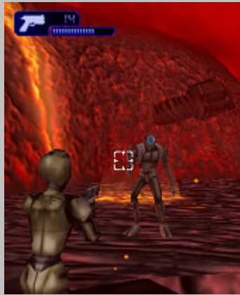
ステージ：灼熱の星