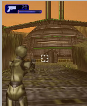
ステージ：溪谷の要塞